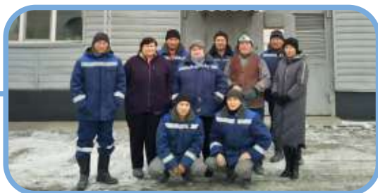
Лучший склад – Склад ГП/ССС/ЛЦ, г. Семей