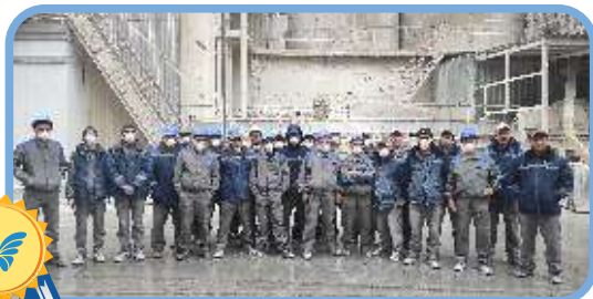
АГЗ, г. Актобе (ПГМ)