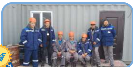
Карьер «Тараз», г. Тараз