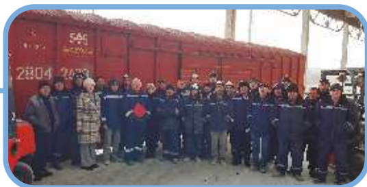
Лучший филиал – Филиал, г. Шымкент