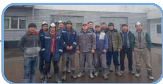
Лучшая бригада грузчиков – Бригада 3, г. Семей