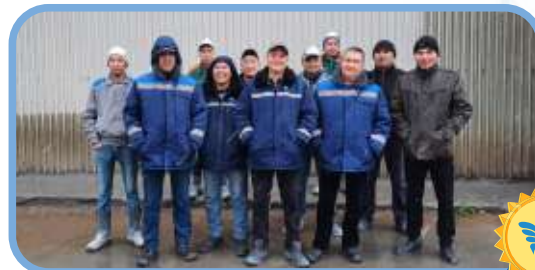
Ауззова, г. Семей (ССС)