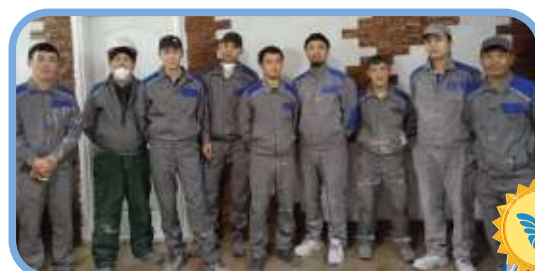
41 разъезд, г. Актобе (ЛКП)